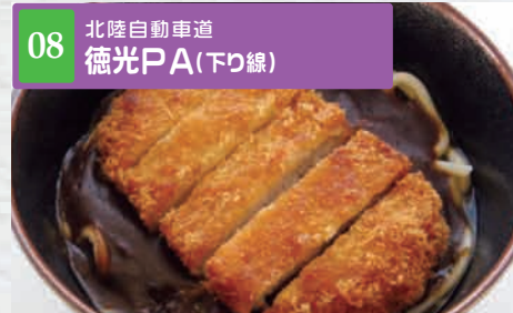
08 北陸自動車道 徳光PA(下り線)

[雪うさぎ] 営業時間 7:00~20:00 お出かけの時に手軽な保冷バッグです! さあランチボックスを持ってピクニックに出かけよう!!