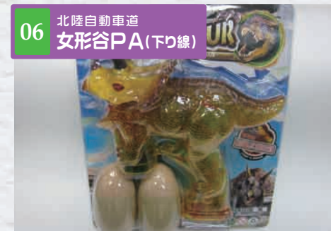
06 北陸自動車道 女形谷PA(下り線)

[フードコート] 提供時間 10:00~18:00 旨辛のカレーうどんの上の、サクサクした豚カツのつたボリュームメニューです。