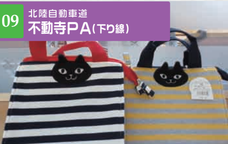
09 北陸自動車道 不動寺PA(下り線)