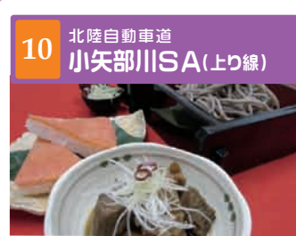
10 北陸自動車道 小矢部川SA(上り線)

[北路] 提供時間 7:00~20:00 夏でも食べたいピリッと辛い味噌ラーメンです。