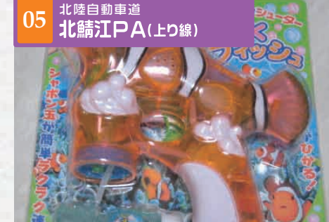
05 北陸自動車道 北鯖江PA(上り線)

[ショッピング] 営業時間 24H ¥302~ 北陸新幹線開通記念グッズが勢ぞろいクリアファイルやストラップなど、新幹線ファンには必見です!!