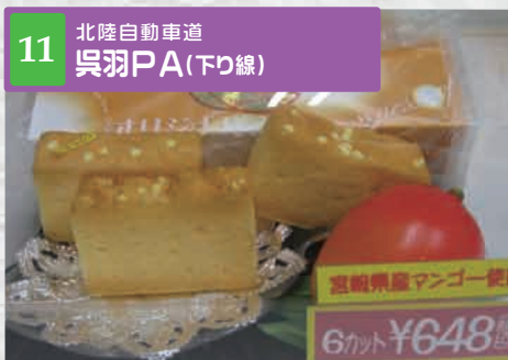
11 北陸自動車道 呉羽PA(下り線)