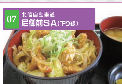
07 北陸自動車道 尼御前SA(下り線)

[レストラン] 提供時間 7:00~22:00 富山ブランド牛の氷見牛ステーキにとろろをかけてお召し上がり下さい。