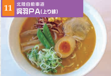
11 北陸自動車道 呉羽PA(上り線)