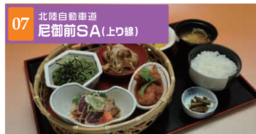
07 北陸自動車道 尼御前SA(上り線)