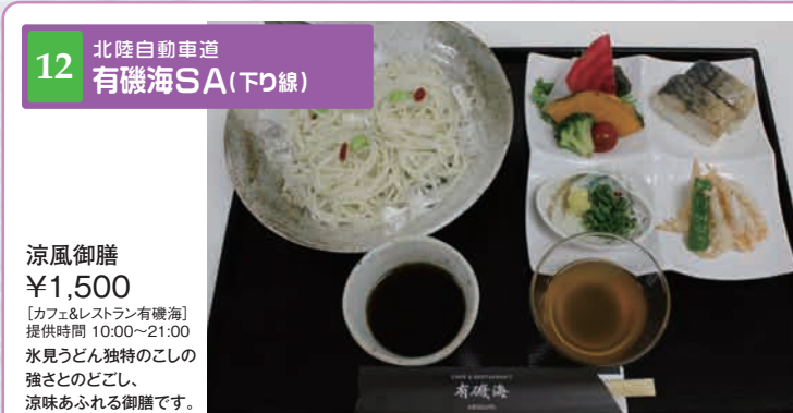
12 北陸自動車道 有機海SA(下り線)

[ショッピング] 営業時間 24H ティラノサウルスをイメージした組み立て工作キットです。