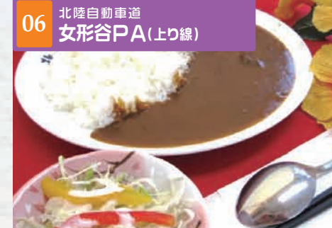
06 北陸自動車道 女形谷PA(上り線)

[ショッピング] 営業時間 7:30~19:30 地元の河北で作っているまつやとり野菜みそを使用したまんじゅうです。