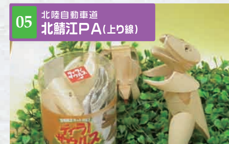
05 北陸自動車道 北鯖江PA(上り線)

[ショッピング] 営業時間 24H 海や山のレジャーに自衛隊の迷彩ハットがおしゃれ。