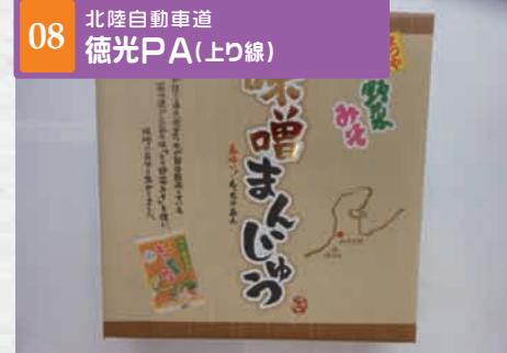
08 北陸自動車道 徳光PA(上り線)

[ショッピング] 営業時間 7:00~20:00 金沢五郎島金時のさつま芋を使った洋菓子です。