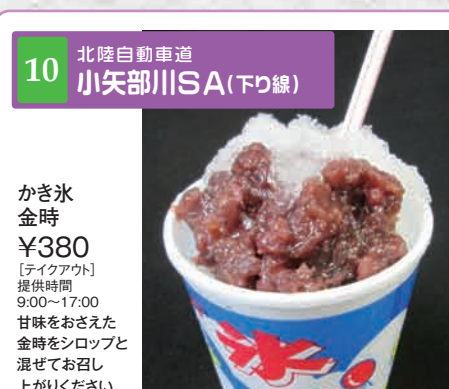
10 北陸自動車道 小矢部川SA(下り線)

[ショッピング] 営業時間 7:00~20:00 夏のフルーツの王様「マンゴー」を称した贅沢なチーズケーキです。