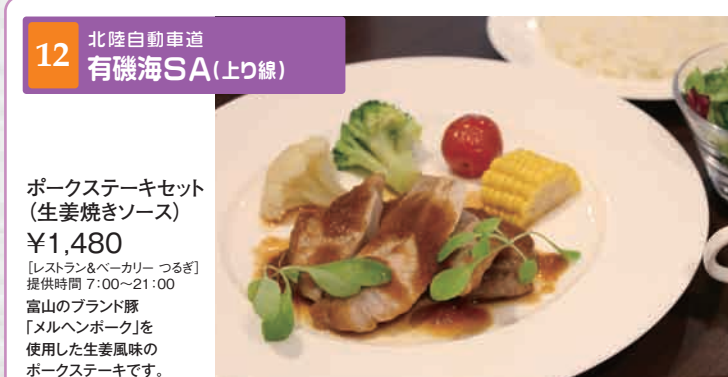
12 北陸自動車道 有機海SA(上り線)

[ショッピング] 営業時間 7:30~19:30 山で、公園・広場で遊べる一風変わったシャボン玉です。