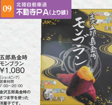
09 北陸自動車道 不動寺PA(上り線)