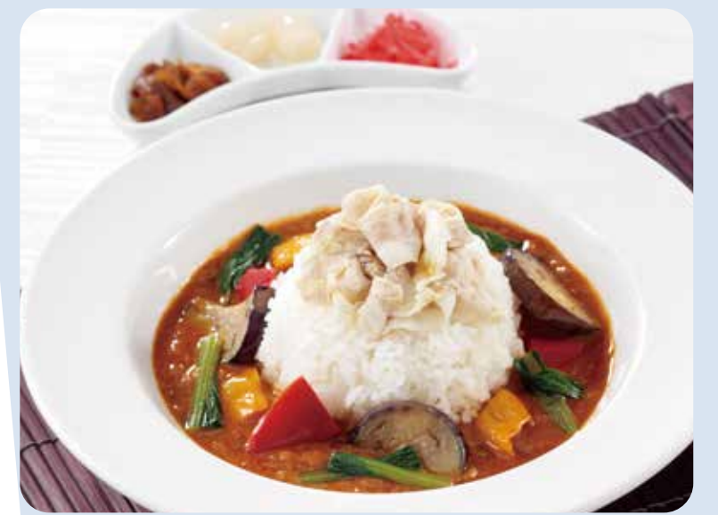
丸の内ポルスター あつき豚と県産野菜の冷製カレー