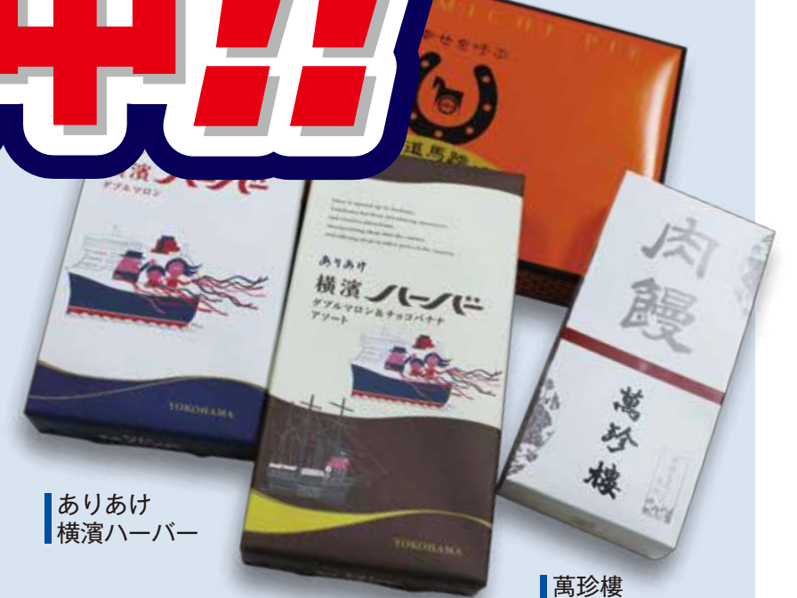
ありあけ 横浜ハーバー