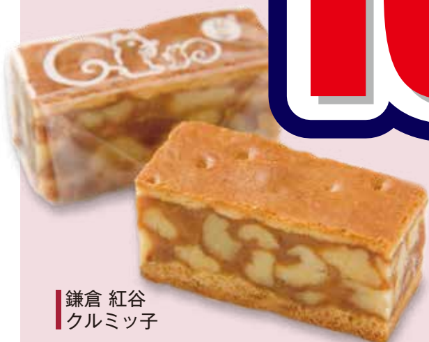
鎌倉 紅谷 クワミツチ