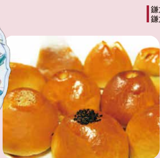
鎌倉五郎本店 鎌倉半月