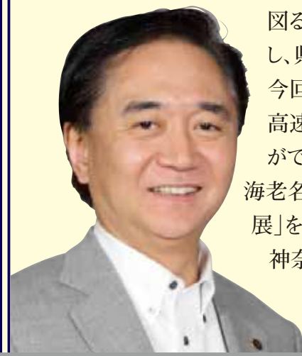
神奈川県知事 黒岩 祐治

神奈川県は、温暖な気候と変化に富んだ地形に恵まれ、さらには相模湾と東京湾に面し、それぞれの地域の特徴を生かした農林水産業が営まれています。そして、県内産の農林水産物や加工品を、多くの皆さんに知っていただき、農林水産業の活性化を図るため、一定の品質を確保している産品等を「かながわブランド」として登録し、県のホームページ「かなさんの畑」等で積極的にPRしています。今回は、中日本エクス株式会社社の企画により、日本一の利用者数を誇る東名高速道路海老名SAで、「かながわブランド」などの産品の魅力を直接感じることができる「神奈川県フェア」を開催していただくことになりました。海老名SAの下り線では「神奈川県うまいもの祭り」を、上り線では「鎌倉・湘南物産展」を開催していますので、お出かけやご旅行の思い出として、この機会に様々な神奈川県産品をぜひお楽しみください。