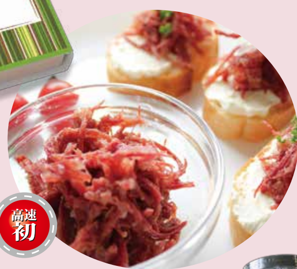
ハム工房ジロー 黒毛和牛コンビーフ