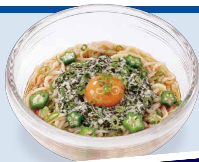
そば処信濃 アカモクとろろうどん