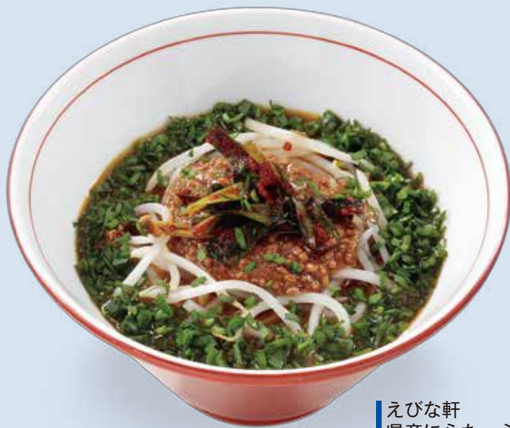
えびな軒 県産にらたっぷりラーメン