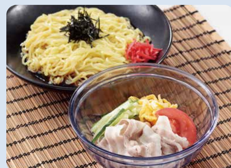
いろどり家 横浜醤油とあつき豚の冷し中華