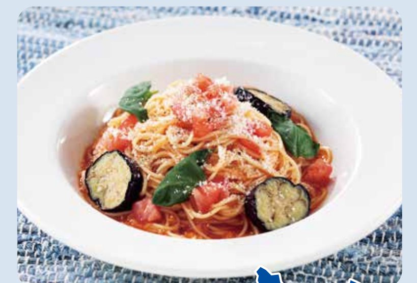
バスカーア 湘南トマトの冷製カッパレ二