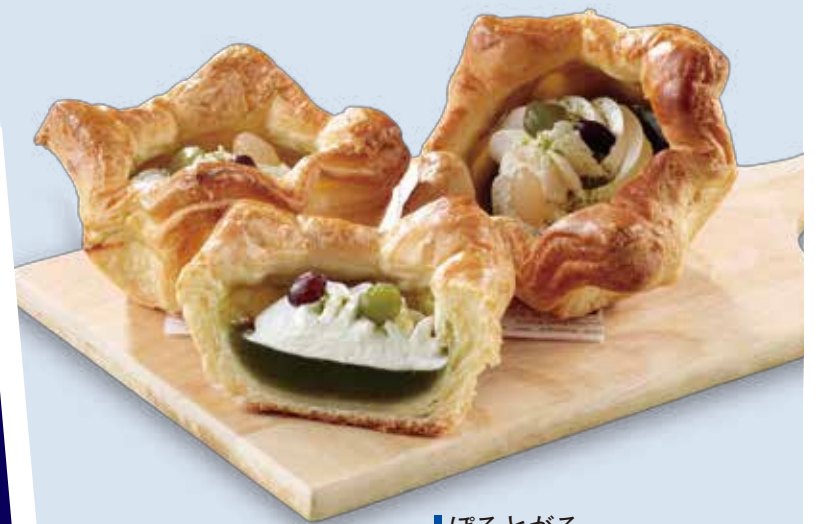
ほととがる 足柄茶の羊羹デニッシュ