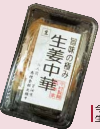
今村製麺総本家 生姜中華醤油味