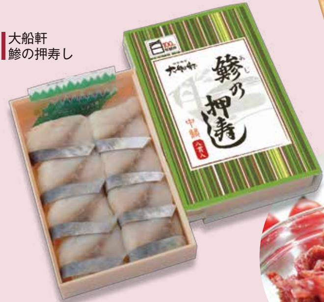
大船軒 鱈の押寿し