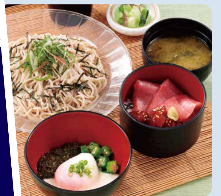
海鮮三崎港 ねばねばアカモクそば三崎まぐろ丼