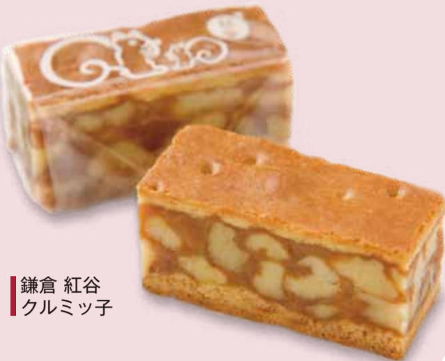
鎌倉紅谷 クルミツ子