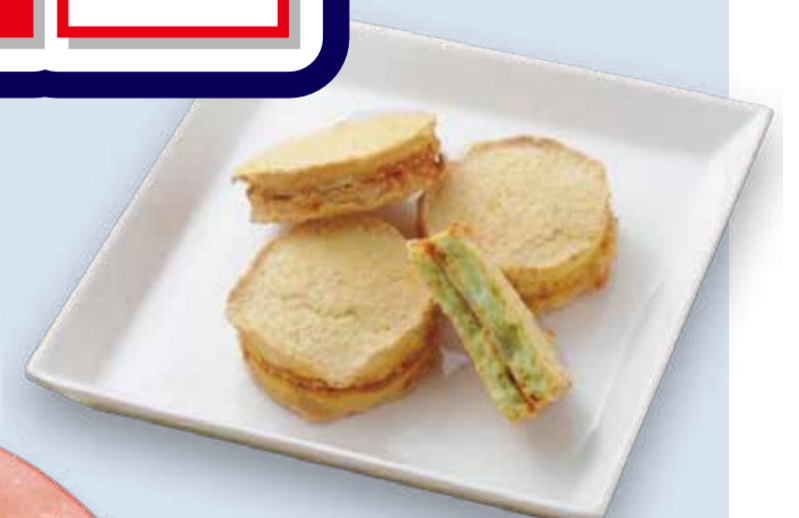
ショウエイ メロンパンダッグワーズ