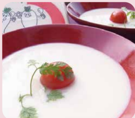
福来鳥 ザ・SOUP 大根