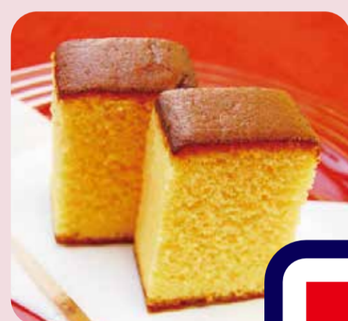
日影茶屋 葉山カステラ らんどう