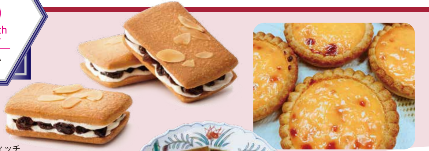
鎌倉小川軒 レーズンウィッチ