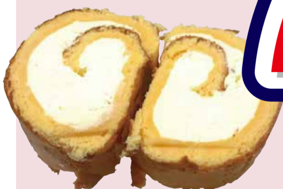
精栄軒 ロールケーキ切落とし