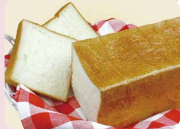
ブレドール エシレ角食パン