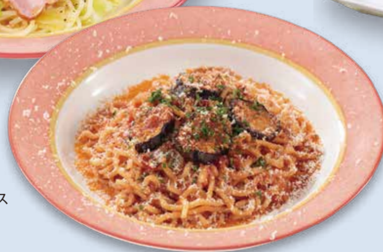
バスクーア ナスの湘南トマトソース