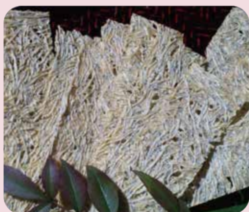
湘南いぶし ガンさんの燻製工房 たたみいわし燻製