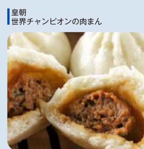
皇朝 世界チャンピオンの肉まん