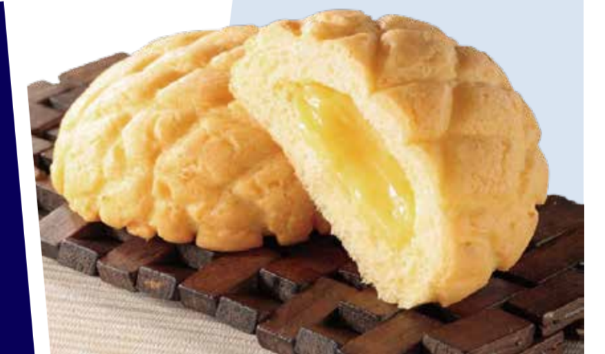
ほるとがる 湘南ゴールドクリームパン