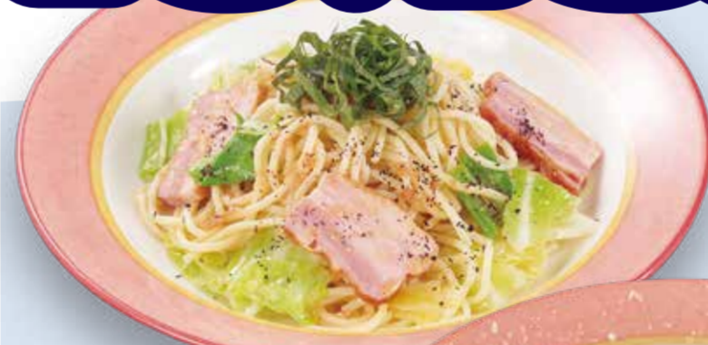
バスクーア 梅! すっぱチーノ