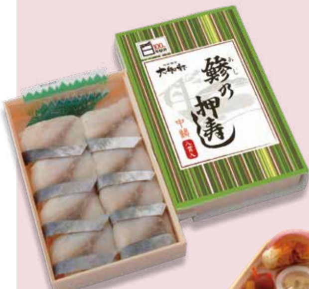
大船軒 鯨の押寿し