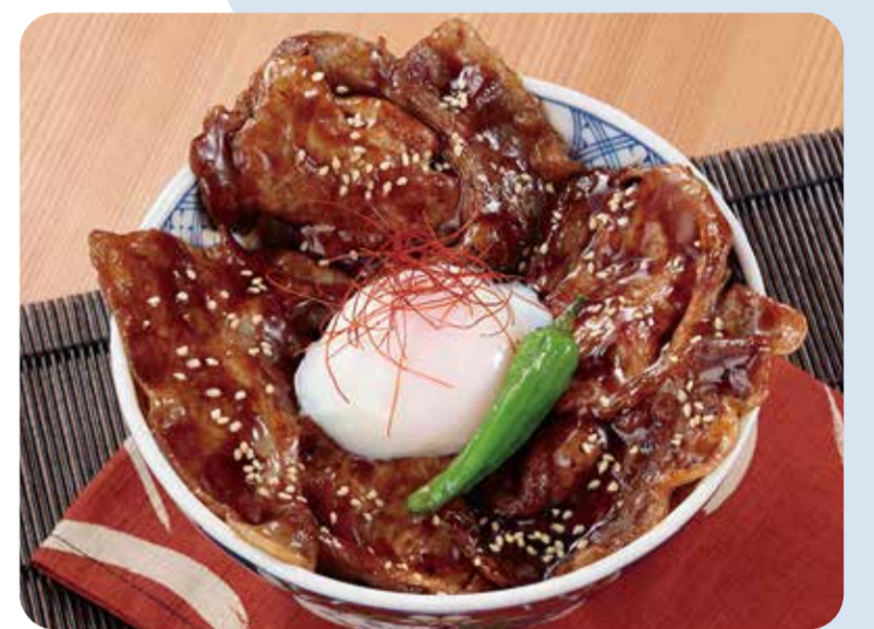
丸の内ポールスター あつき豚豚丼