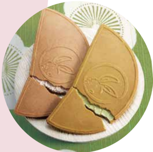
鎌倉五郎本店 鎌倉半月