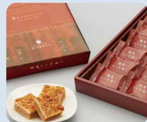
ウイッシュボン 横濱レング通リ