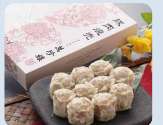
横浜中華街 萬珍楼 豚肉焼売