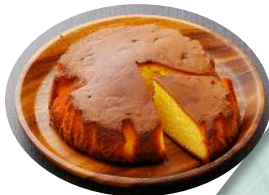
福来蜜カステラ 〔ショップ〕

静岡市内を観光しつつ、遅めのお昼を浜名湖SAで。お買物券があるから、お昼は豪華に「浜名湖産うな重」で。