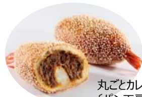
丸ごとカレーパン 〔パン工房ベルベ〕