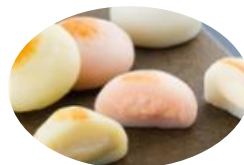
鉾八ひとくちかまぼこ 〔沼津・村の駅〕

おしゃれな外観が目を引く、駿河湾沼津SAで休憩。旅も最後。お土産の買い忘れがないかチェック！