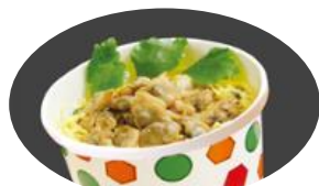
磯坊主 カップライス アサリめし 〔きっちんににぎ〕