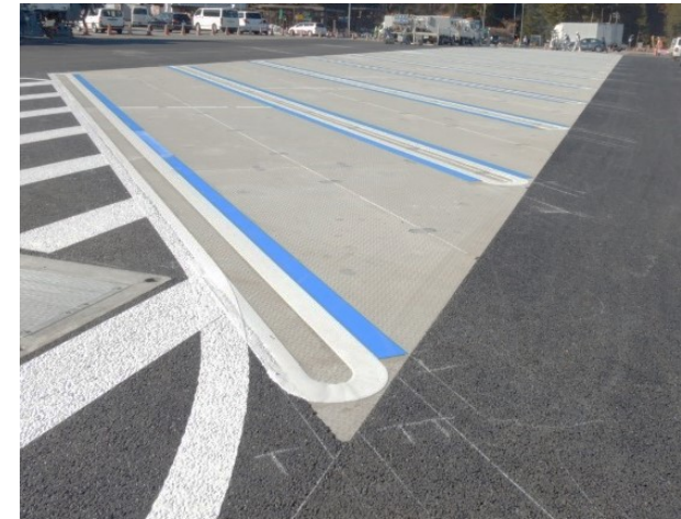
青色ラインでの「普通車・大型車兼用マス」の明示例

○「兼用マス」は、普通車、大型車それぞれの専用駐車マスが満車の場合にご利用ください。