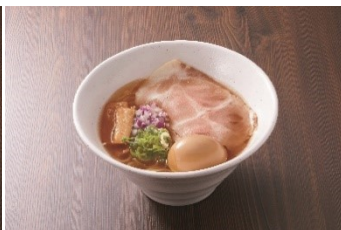
醤油ラーメン煮卵のせ 900 円