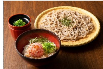
ミニまぐろたたき丼とざるそばのセット 1,200円