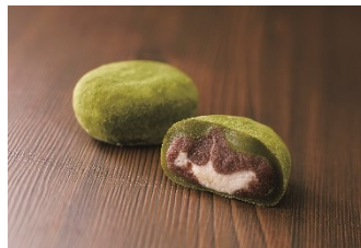
抹茶クリーム大福 1 個 270 円