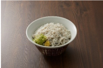
名物 しらす丼 (味噌汁付) 980円