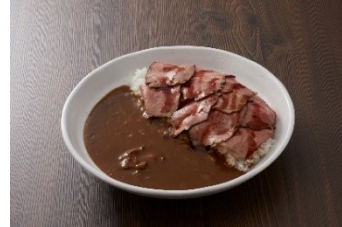
ローストビーフカレー 1,300円