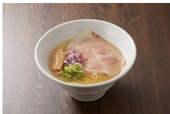
鶏塩ラーメン 800 円