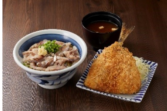
名物 あじ丼とアジフライのセット 1,380円