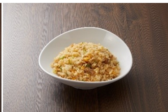
チャーハン 500 円