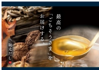
ご馳走だし (和風・海鮮・野菜) 小 972 円