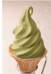
深蒸し茶ソフト 450円