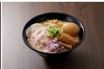
鶏白湯ラーメン全部のせ 1,200 円