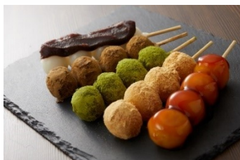
お団子 1本 各種 150円

ご当地 深蒸し牧之原茶を使用した、洗みの少ないまろやかな深蒸し茶ソフトや、串団子、おはぎとバラエティに富んだ和菓子をご用意します。