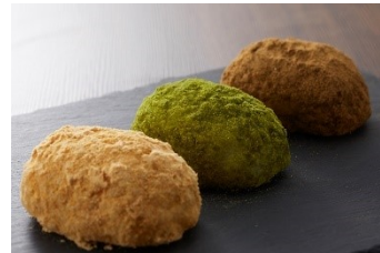
おはぎ 1個 各種 300円