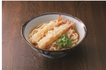
海老天ぷらうどん 980円