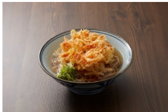
桜海老のかき揚げそば 980円

名物「桜海老のかき揚げ」と選べるミニ丼セットでおなかも満足。喉ごしの良い茹でたての麺と出汁が効いたつゆが自慢です。