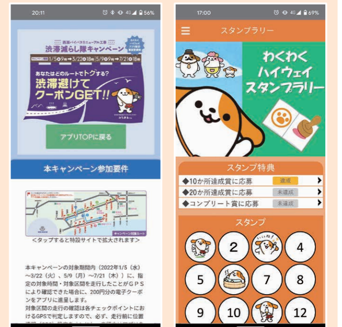
GPS機能を利用したクーポンキャンペーン

※媒体料とは別にキャンペーンページ作成や各種機能の設定に係る、製作費が発生いたします。 ※アプリ制作は当社指定の業者にて実施いたします。 ※WEBクーポンの原資はお客様負担となります。